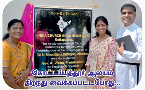
கொட்டப்பத்தூர் ஆலயம் திறந்து வைக்கப்பட்டபோது...

மதுரை மாவட்டத்திலுள்ள பரமன்பட்டி திருச்சபையின் 38ஆவது ஆண்டு விழா மே 10ஆம் தேதியன்று நடைபெற்றது. இந்த நிகழ்வில் கலந்து