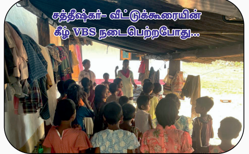
சத்திஷ்கர்- விட்டுக்கூரையின் கீழ் VBS நடைபெற்றபோது...