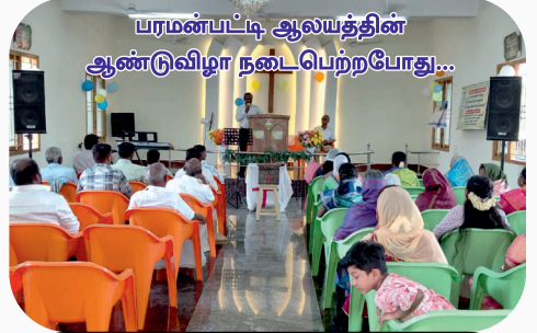
பரமன்பட்டி ஆலயத்தின் ஆண்டுவிழா நடைபெற்றபோது...