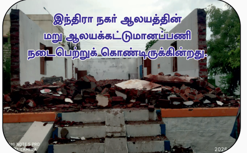
இந்திரா நகர் ஆலயத்தின் மறு ஆலயக்கட்டுமானப்பணி நடைபெற்றுக் கொண்டிருக்கின்றது.