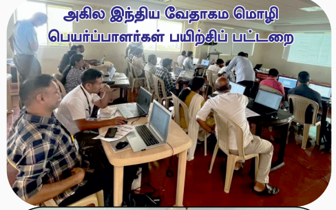
அகில இந்திய வேதாகம மொழி பெயர்ப்பாளர்கள் பயிற்சிப் பட்டறை